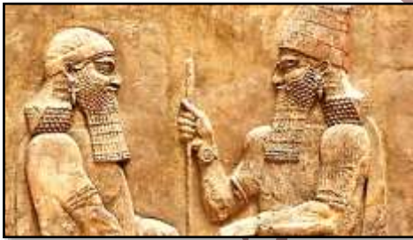
حضارة بلاد العراق القديم