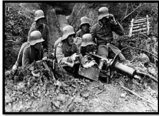
الحرب العالمية الأولى عام ١٩١٤م