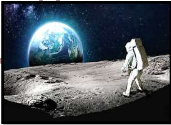
هبوط الإنسان على سطح القمر