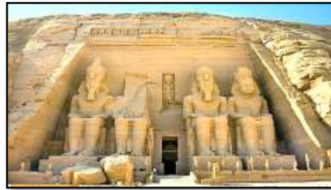
الحضارة المصرية القديمة (الفرعونية)

تبدأ منذ (سقوط الإمبراطورية الرومانية) عام ٤٧٦ م وحتى (فتح القسطنطينية عاصمة الدولة البيزنطية على يد السلطان العثماني محمد الثاني) عام ١٤٥٣ م مما أدى لسقوط الإمبراطورية الرومانية الشرقية.